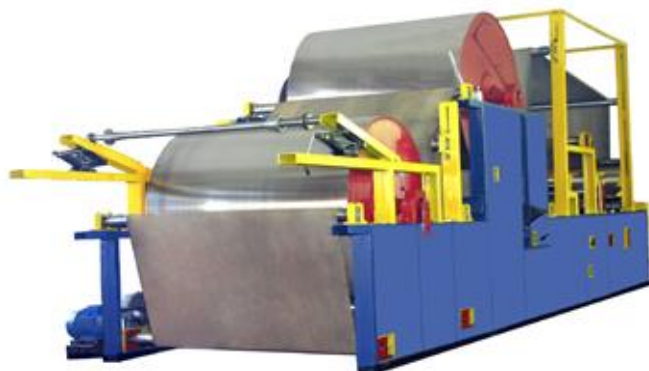
Рисунок 1 – Бумагоделательная машина

Комплект оборудования, входящий в состав Мини-завода – это оборудование для подготовки бумажной массы, бумагоделательная машина (БДМ-ПАР) и комплект необходимых станков (рисунки 1, 2, 3), предназначен для переработки вторичного сырья из макулатуры для производства бумаги санитарно-гигиенического (бытового) назначения (туалетной бумаги, бумажных полотенец).