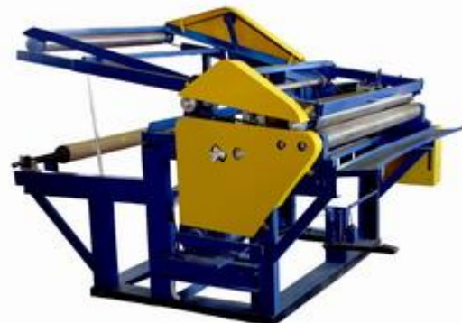
Рисунок 2 – Бобиноразмоточный станок