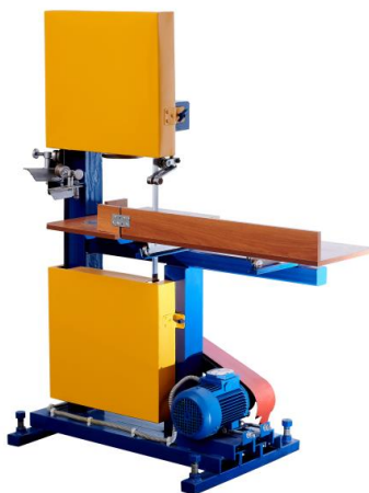
Рисунок 3 – Станок для нарезки рулончиков